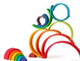
アーチレインボー