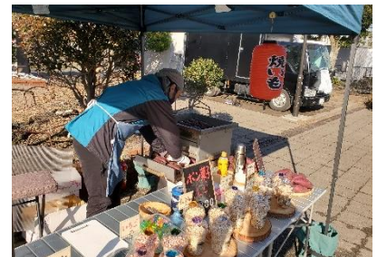
焼き芋とポン菓子