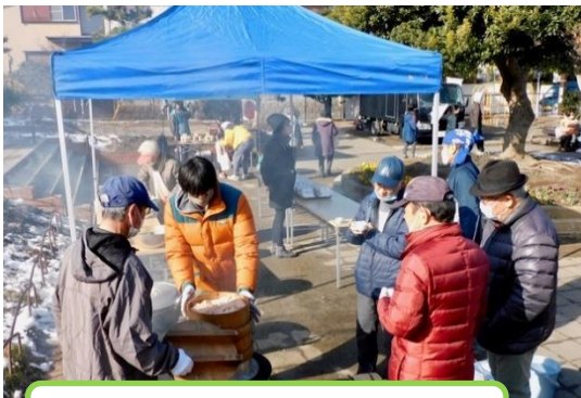
お赤飯が蒸しあがりました！