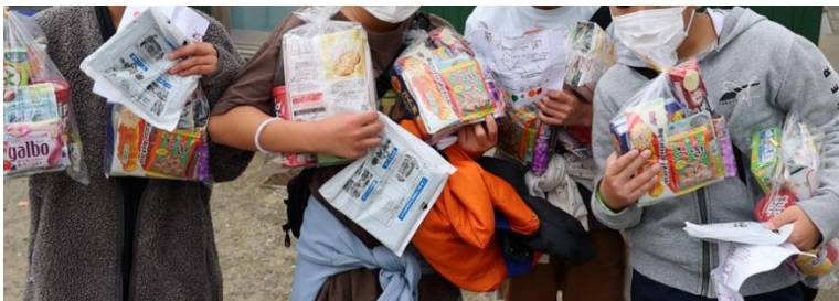
↑参加賞はお菓子詰め合わせと有料ゴミ袋。「思ったより豪華♪」

自分の体力、脚力、やる気に合わせて、行きたいチェックポイントを回ればOKというルールでしたが、完全制覇を成し遂げた方が20名も！ そのうち9名は小学生と、なんとも頼もしい結果となりました。