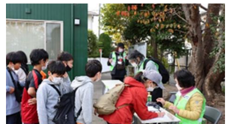
↑町内会館前でエントリーして、スタート！

今にも冷たい雨が降り出しそうな、あいにくの曇天の中、今泉台からは総数81名が参加。一番遠いチェックポイントである“五社神社”は、鎌倉街道の鎌倉女子大前交差点より先にあるため、7か所のチェックポイントをすべて回るには、かなりの脚力が必要です。