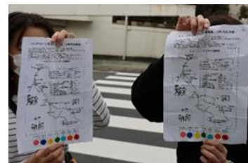
↑見事、コンプリート。すごいっ！

ご家族、ご友人達で気軽に楽しめるスタンプウォークラリー。今後も町内会のイベントとして続けていきたいと思っております。