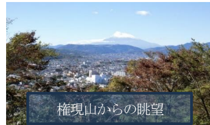
権現山からの眺望