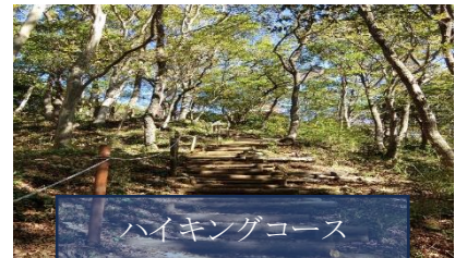
ハイキングコース