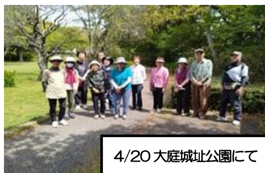
4/20 大庭城址公園にて