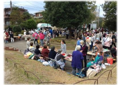
<昨年10月のマルシェ風景>

来る 3月25日（土）11時から 、恒例の春の【今泉台マルシェ】を 吉ガ沢公園 で開催致します。出店品目は焼き芋、ビール、弁当、お結び、和菓子、コーヒー、ケーキ、パン、クッキー、ポン菓子、焼き菓子、野菜、花類、手芸品など。これ以外に、昨年のおにも出店した「キッチンカー」も予定しております。なお、NPOでは鎌倉市で展開している「かまくらプラゴミゼロ宣言」に協力していますので、 マイバッグ、マイカップ、マイ容器持参 でご来場下さい。