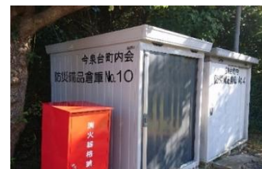
7丁目クローバー広場の第10倉庫