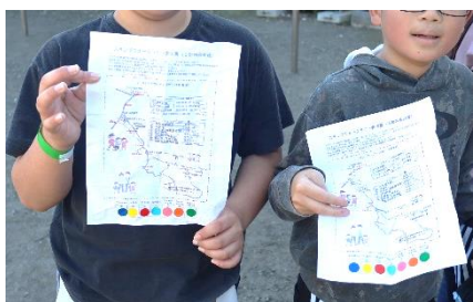
すべてのチェックポイントを制覇！

小学生だった少年が、この町で育ち、大人になり、家族を持ち、その家族と一緒にスタンプウォークラリーに参加し、恩師と再会。月日の流れと巡る時に、人々が繋がる。そんな温かいドラマも生まれ、赤や黄色に色づき始めた木々の中に、たくさんの笑顔が加わった一日となりました。