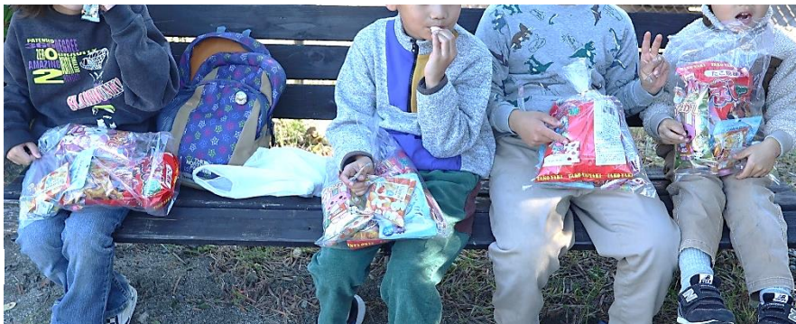
ゴールでもらえる豪華な大袋の参加賞。今年はキャンディのつかみ取りも！

※町内会ホームページでは、ここでご紹介できなかった写真も掲載しています。ぜひご覧ください。